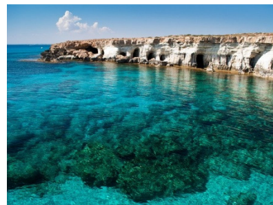
Cape Greco - Larnaca

25% dell'intero importo per annullamenti da 60 fino a 31 giorni prima della partenza