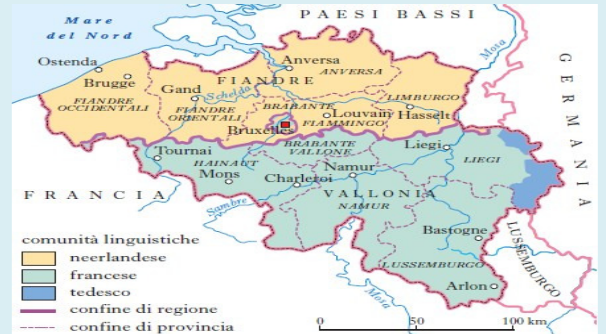
(Landkarte der Enciclopedia Treccani)

In Belgien gibt es drei Regionen ("gewesten"): die Flämische Region, die Wallonische Region und die Region Brüssel-Hauptstadt. Weiterhin existieren drei Gemeinschaften ("gemeenschappen"): die Französische, die Flämische und die Deutschsprachige Gemeinschaft. Die Befugnisse der Gemeinschaften und Regionen sind festgelegt, weiterhin haben sie jeweils eigene Parlamente und Regierungen (in Flandern sind Regions- und Gemeinschaftsregierung zusammengeschmolzen). Die Regionen sind mit den deutschen Bundesländern vergleichbar. Sie sind unter anderem zuständig für Ökonomie, Landwirtschaft, Arbeits- und Wohnungswesen. Die drei Gemeinschaften zeichnen sich für Sprache, Kultur und Bildung verantwortlich. Die föderale Regierung ist federführend bei Finanzen, Justiz, der Armee und im Bereich sozialer Sicherheit. (Abstract : neon.niederlandistik.fu-berlin.de)