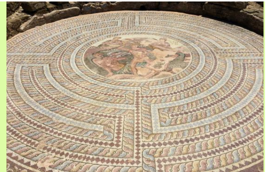
Gräbern der Könige aus dem vierten Jh.v. Chr.,

Frühstück im Hotel. Treffen mit dem Reiseleiter und Abreise nach Paphos, einer Stadt auf der UNESCO-Liste des Weltkulturerbes, im westlichsten Teil der Insel Zypern. Wir halten am berühmten Strand von Petra Tou Romiou, wo nach der griechischen Mythologie die Göttin Aphrodite aus dem Wasser auftauchte. Weiter geht es mit einem Besuch der Kirche Agia Paraskevi, einer der interessantesten byzantinischen Kirchen der Insel, die von fünf Kuppeln überragt wird und wertvolle Fresken aus dem 15. Jahrhundert enthält. Wir besuchen das Haus des Dionysos, dessen Mosaikböden aus dem dritten Jahrhundert n. Chr. stammen und zu den schönsten im östlichen Mittelmeerraum gehören. Der Besuch beinhaltet einen Stop an den die.