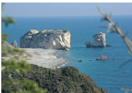
Petra Tou Romiou – Felsen von Afrodite